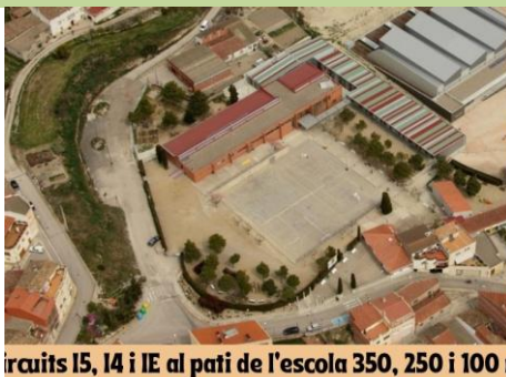
Circuits I5, I4 i IE al pati de l'escola 350, 250 i 100 m